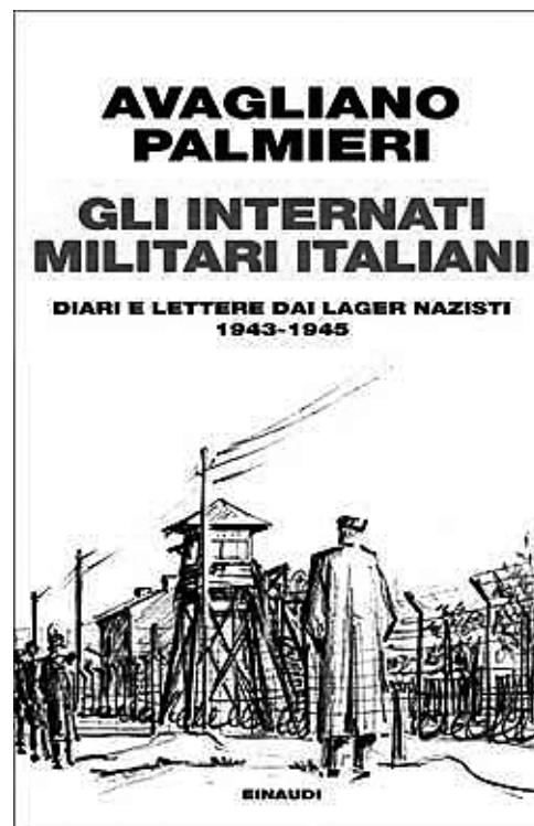
La copertina del libro di Avagliano-Palmieri; in basso lager nazisti

In seguito a questa scelta gli Imi andarono incontro – «volontariamente», come scrisse nel suo diario clandestino Giovannino Guareschi, l'autore di Don Camillo e Peppone all'epoca giovane