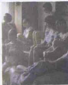
Opera di Sanja Lasic

È dedicata al musicista Alberto Fortis la mostra collettiva che apre mercoledì 26 gennaio alle 19.30 al ristorante Al Garibaldi (viale Monte Grappa 7, tel. 026598006; fino al 26 febbraio). Titolo "In soffitta. Crisi e mutamento", come il